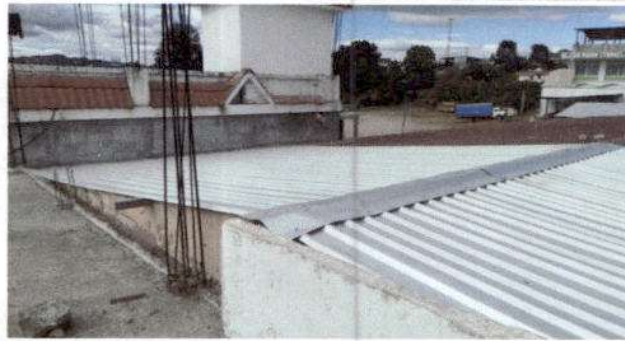
Foto1:Sustitución de lámina, por lámina troquelada aluzinc calibre 26