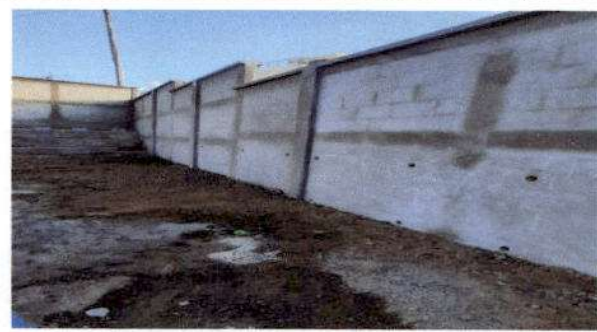
Foto 4: Sustitución de muro perimetral de block con cemento, columnas y soleras intermedias